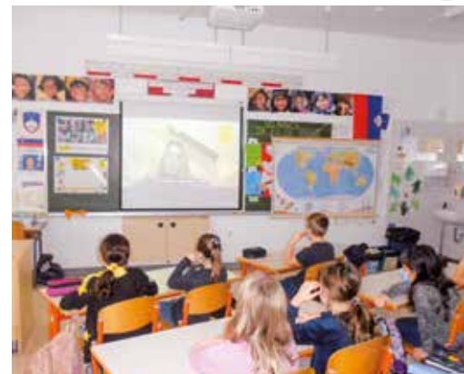
Pišem za pravice 2021 na Osnovni šoli Idrija.

Pogosto se tudi res spremeni oz. izboljša njihova situacija: odpravijo se obtožbe, z njimi zaporniške oblasti ravnajo manj grdo, spremenijo se zakoni itd.