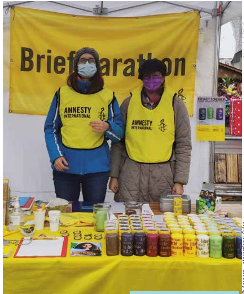
Aktivista iz Amnesty Švice med akcijo za Pišem za pravice 2021.

Človekove pravice niso privilegij, ki bi ga spoštovali le, če to dopuščajo okoliščine.